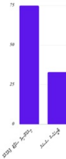
المرجعات الخمسة عشر التي وردت في القرآن الكريم